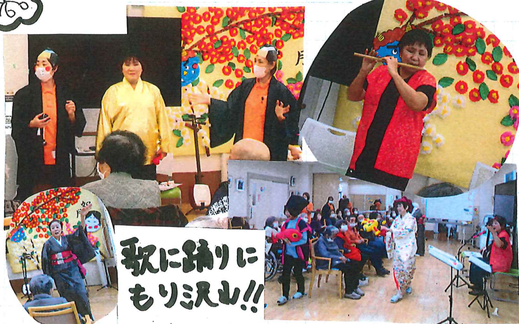
歌に踊りに もり込む!!