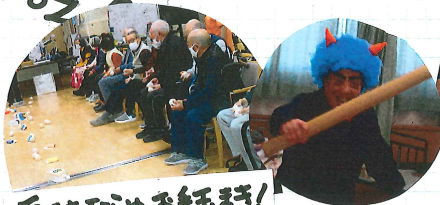
豆まきならぬお手玉まき！