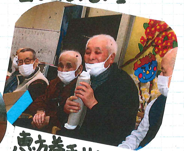
恵方巻きリレー ゴールの「ハッキリ」 ポーズ♪